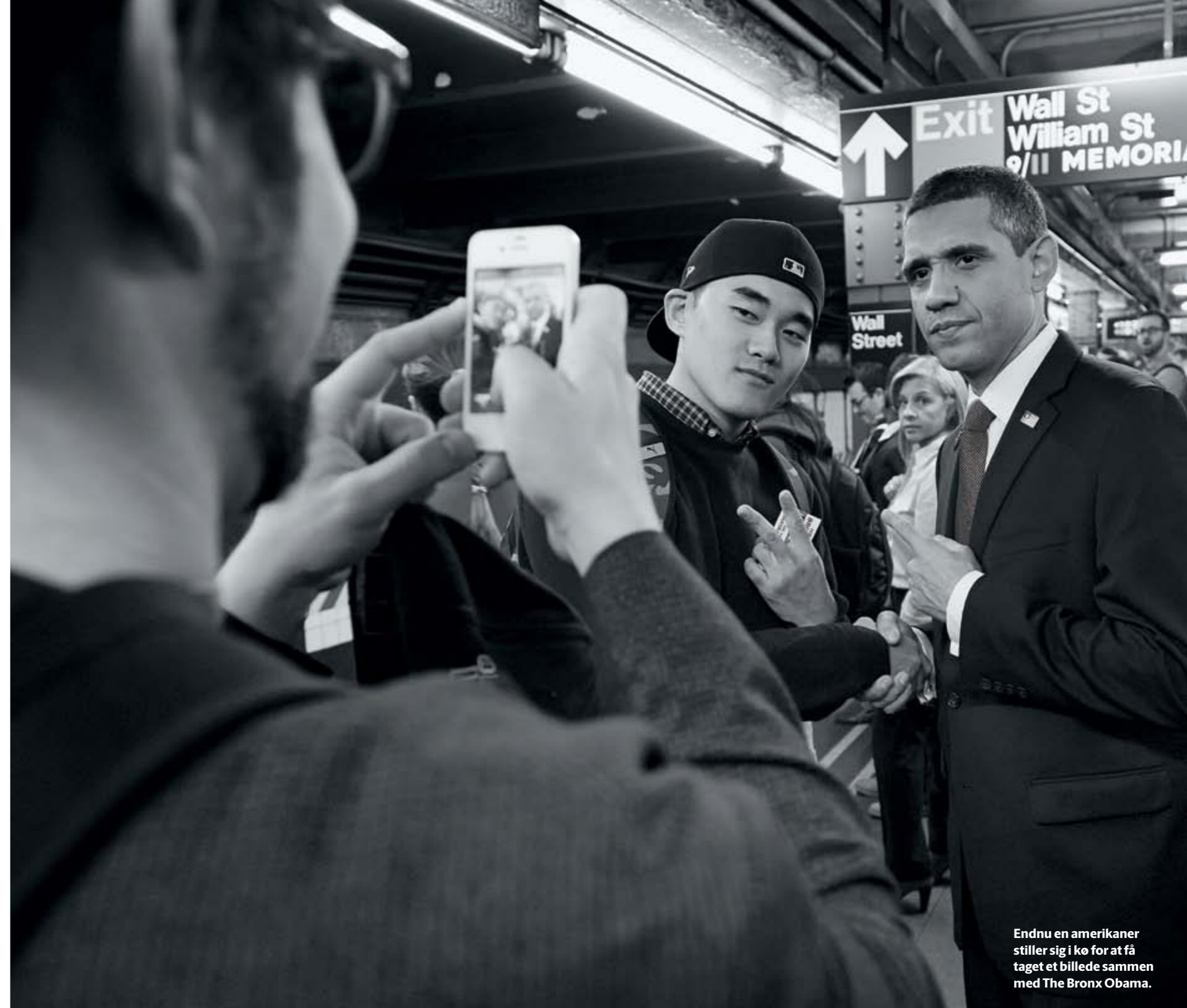
Endnu en amerikaner stiller sig i kø for at få taget et billede sammen med The Bronx Obama.